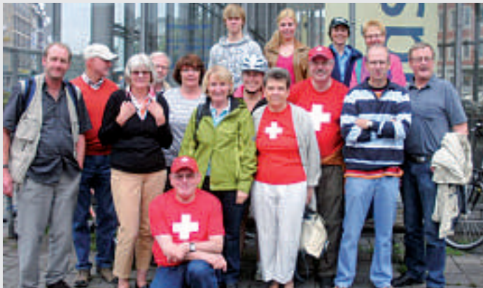
Die Pedalritter kamen aus Essen, Mülheim a.d. Ruhr, Düsseldorf, Ratingen, Osnabrück, Werne und Münster.