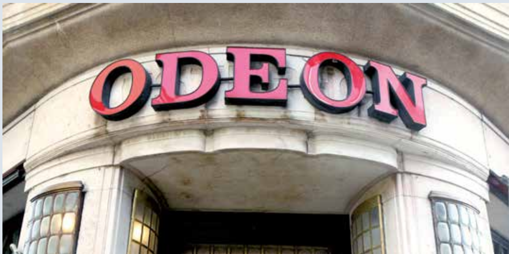
Das Café Odeon in Zürich war ein beliebter Treffpunkt von Künstlern.

Das Zürcher Café Odeon – das im Jugendstil errichtete Kaffeehaus nach wienerischem Vorbild eröffnete am 1. Juli 1911 – war ein Archipel des Geistes, ein Laboratorium der Literatur. Es war ein Lieblingssort von «Homo Faber»-Autor Max Frisch. Frisch sass an seinem Tisch und rauchte genüsslich seine Pfeife. Er notierte unter der Ortsangabe «Café Odeon» auch welthistorische Ereignisse. So vermerkte Frisch im Tagebuch, dass die «Teilung Deutschlands, seit Kriegsende vorhanden, nun verkündet und vollstreckt (sei) – es liest sich wie die Exposition eines Dramas.» Neben dieser Tagebuchnotiz aus dem Jahr 1948 spielte Kaffee auch in Frischs Werken eine grosse Rolle.