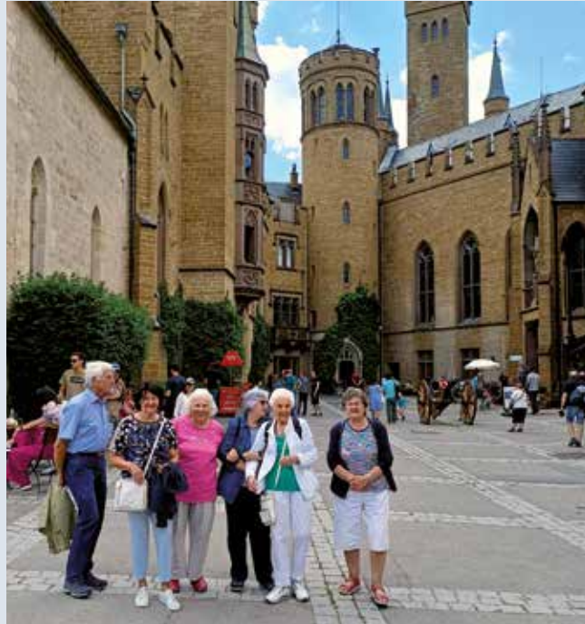
Im Innenhof der Burg Hohenzollern