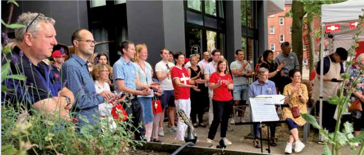
Vor und im Theatersalon «Die 2te Heimat» in Altona ging so richtig die Post ab

Die beiden norddeutschen Vereine feierten gemeinsam ihren Geburtstag und schrieben sich augenzwinkernd gleich 270 Jahre auf die Fahne; wobei «Helvetia» Hamburg 140 Jahre beitrug und der Schweizer Verein Schleswig-Holstein 130 Jahre beisteuerte. In welchem Kanton wird Rivella hergestellt?