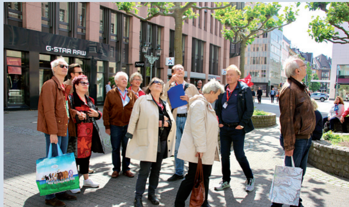
Auf verschiedenen Führungen durch die alte oder die moderne Stadt konnten die Gäste die Rheinmetropole erkunden.