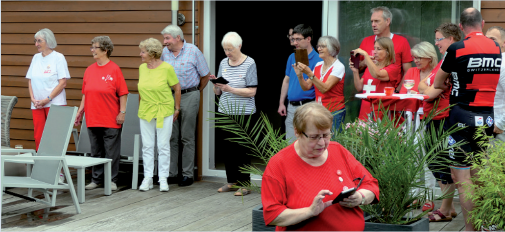
Die Mitglieder freuen sich über ein kleines Feuerwerk anlässlich der Bundesfeier im vergangenen Jahr in Pulheim.

Der Verein umfasst derzeit siebzig Erwachsene und fünf Kinder. Die Mitglieder bestehen neben dem aktiven engen Kreis natürlich auch aus einer Vielzahl von Landsleuten, die auf Grund des Alters nicht mehr aktiv am Vereinsleben teilhaben können. Wir versuchen durch regelmässige Post und kleine Geschenke wie die Weihnachtstasche, gefüllt mit kleinen Überraschungen, aktiv Kontakt zu halten.