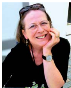
MONIKA UWER-ZÜRCHER REDAKTION DEUTSCHLAND

Noch immer macht mir die Arbeit am Heft richtig Spass. In diesen 25 Jahren hat sich für mich die Geografie Deutschlands verändert. Osnabrück, München, Hamburg, Münster